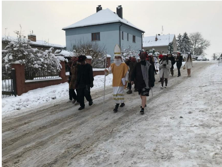
Mikuláš přichází do školy (loňský rok). To bylo sněhu!

Svatý Mikuláš z Myry byl biskup. Už za svého života byl velmi oblíbený mezi lidmi. Proslul a proslul svou štedrostí k potřebným. Jde o jednoho z nejuctívanějších svatých v celém křesťanství. Svato Mikuláš je uctíván jako patron námořníků, obchodníků, lukostřelců, dětí, lékárníků, právníků, studentů a vězňů. V kalendáři připadá jeho svátek na 6. prosince a v předvečer tohoto svátku chodí Mikuláš s čertem a andělem a rozdává hodným dětem dárky.